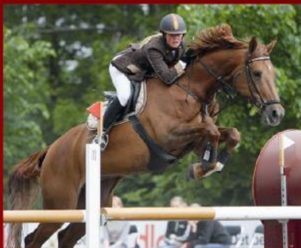
Bronzemedaljehoppen Andante BRDH e. A-Dur/Voltaire er optaget i springhesteprogrammet. Hoppen vandt to World Cup kvalifikationer og deltog ved World Cup finalen i Las Vegas 2005.