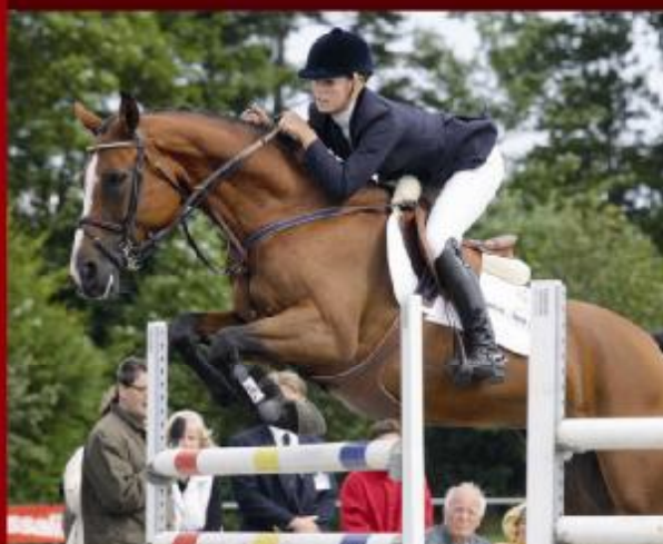
Guldmedaljehoppen Strandgårdens Mercedes Z GRDH e. Robin Z II/Charmeur er optaget i springhesteprogrammet. Hoppen vandt som B årig tre internationale Youngster finaler, og har sidenhen været placeret i Grand Prix klasser og til World Cup.