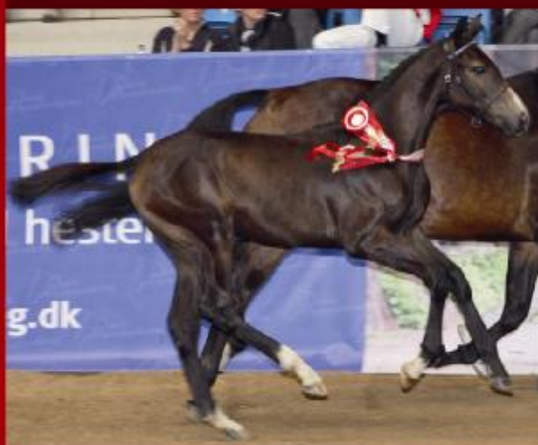
F.A. Cordeau e. Colman/Quinar er født ind i Dansk Varmblods springhesteprogram. Han blev årets bedste springbetonede hingsteføl 2008, og skabte rekord som dyreste springeføl solgt for 400.000 kr. på Dansk Varmblods Elitefølauktion.