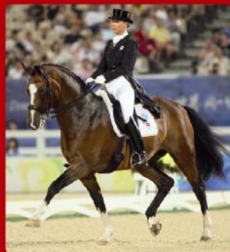
EXQUIS CLEARWATER CARPACCIO / LIMEBRAND