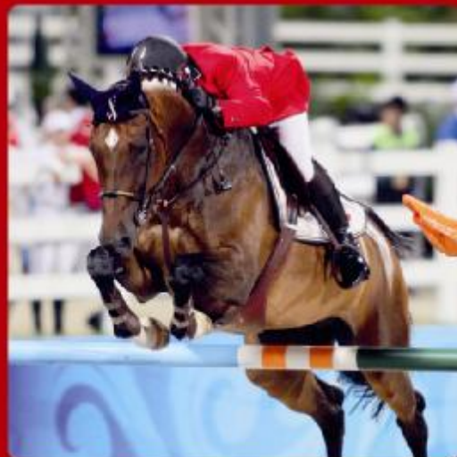
FRIDA EX. LIGITTA COME BACK II / LIMELIGHT