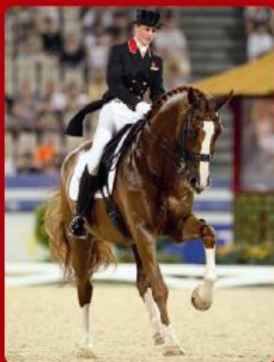
MISTRAL HØJRÍS MICHELLINO / IBSEN