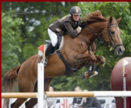
Bronzemedaljehesten Andante BRDH e. A-Dur/Voltaire er optaget i springhesteprogrammet. Hoppen vandt to World Cup kvalifikationer og deltog ved World Cup finalen i Las Vegas 2005.