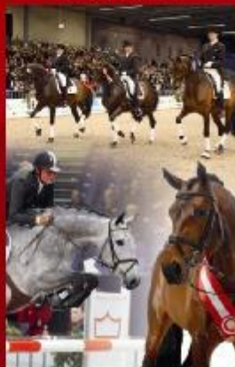
Hingstekåring, konkurrenceklasser & unghestechampionat