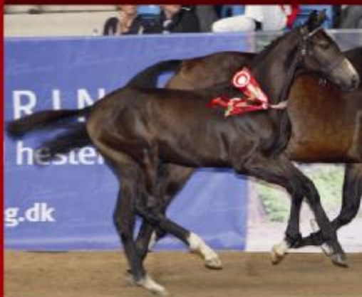
F.A. Cordeau e. Colman/Quinar er født ind i Dansk Varmblods springhesteprogram. Han blev årets bedste springbetonede hingsteføl 2008, og skabte rekord som dyreste springføl solgt for 400.000 kr. på Dansk Varmblods Eliteförelauktion.