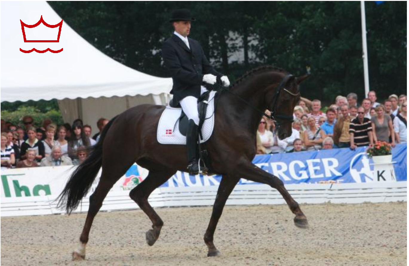
Vallakken Hønnerups Driver e. Blue Hors Romanov DVH 818 m: Hønnerups Zazzi RDH mf.: Blue Hors Don Schufro DVE 690, født hos Stutteri Hønnerup på Fyn, er ud af en avlssikker dansk hoppestamme med høje præstationer i dressur. Ekvipagen blev ved Unghestechampionatet i Herning nr. 2 og ved ungheste-VM i Verden en flot vinder - Dansk Varmblods første guldmedalje ved et ungheste-VM.