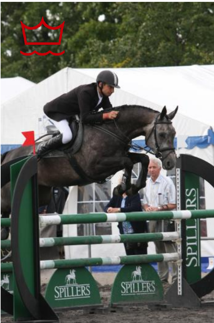
Sølvmedaljehoppen Cadini blev nr. 2 ved Dansk Rideforbunds championater for 5-års heste i 2008. Cadini er efter Carano DVE 521 m: Escudini DH MF: Escudo