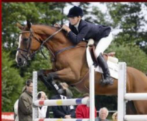
Guldmedaljehesten Strandgårdens Mercedes Z GRDH e. Robin Z II/Charmeur er optaget i springhesteprogrammet. Hoppen vandt som 8 årig tre internationale Youngster finaler, og har sidenhen været placeret i Grand Prix klasser og til World Cup.