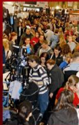
Nordeuropas største messe med alt til dig og din hest