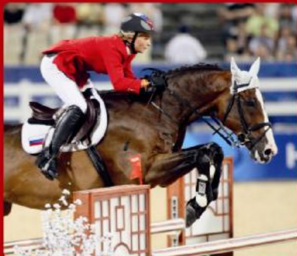
ILION KILEN I LOVE YOU / LAVALLO