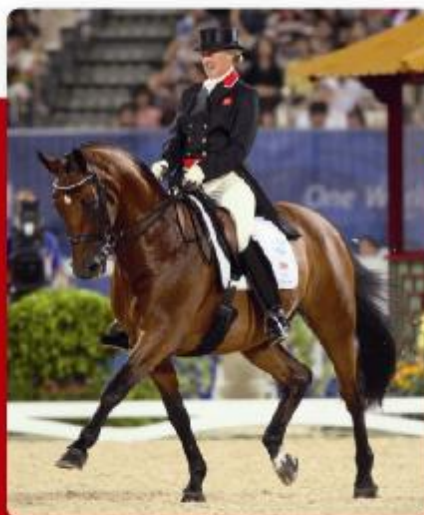
LUCKY STAR LUCKY LIGHT / DONAUWIND